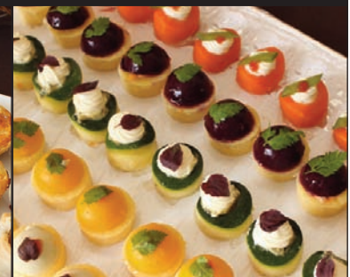
Bouchées du potager