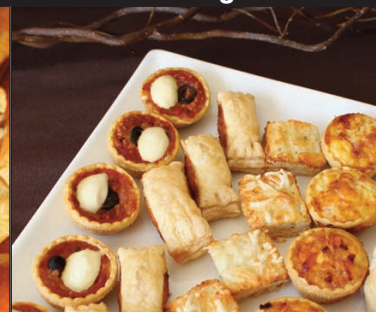
Fours salés chauds