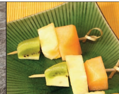
Brochettes de fruits