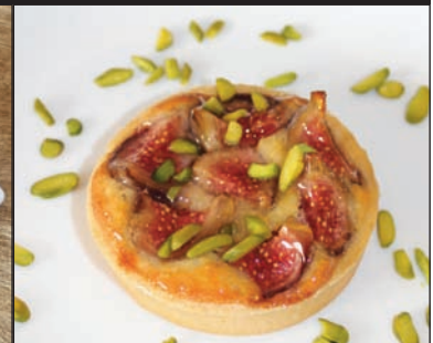
Tartelette figues pistaches