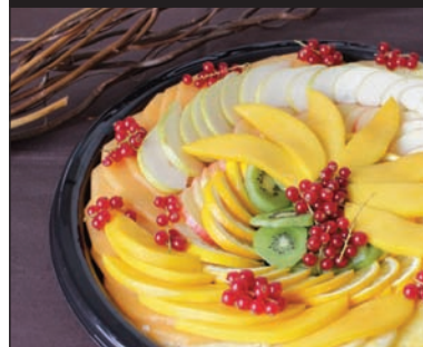
Carpaccio de fruits frais