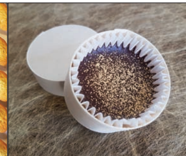
Mini boîte dessert