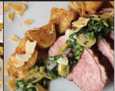
Magret de canard, pistou de persil