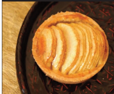
Tarte aux pommes