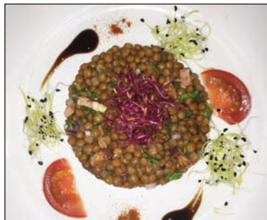
Salade de lentilles