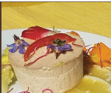
Panna cotta au saumon fumé