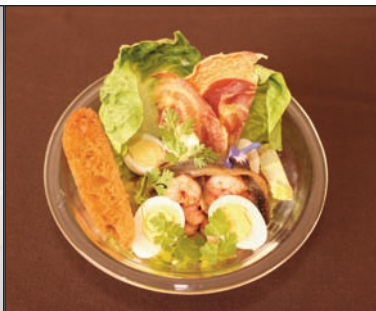
Salade César aux crevettes, pancetta