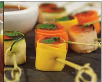
Maki de légumes