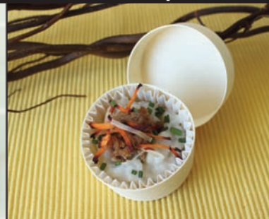
Mini boîte chaude