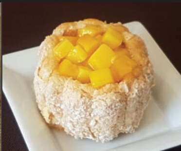
Charlotte à la mangue