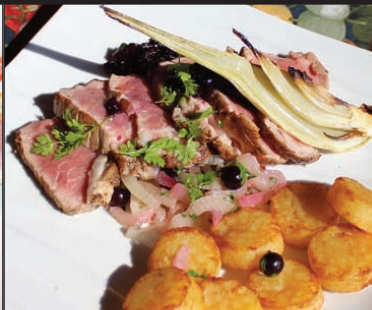
Filet de veau sauce cassis