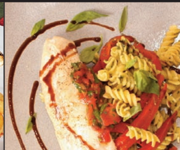
Filet de dorade, fusilli