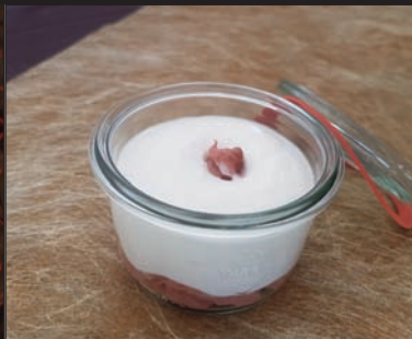
Fromage blanc à la rhubarbe