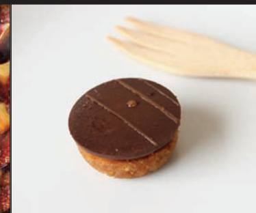
Gourmandise tout chocolat