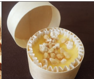
Mini boîte dessert