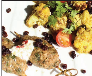
Brochette d'agneau et chou-fleur