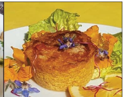
Gratin de carottes, cumin et orange