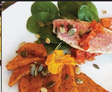
Filet de rougets et patates douces