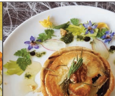
Tartelette aux oignons et chèvre